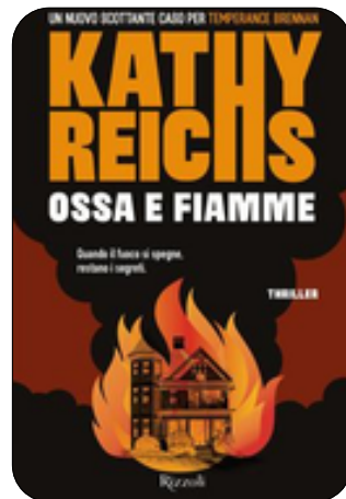
Ossa e fiamme Kathy Reichs 322 p., Rizzoli, 2025