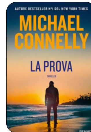
La prova Michael Connelly 361 p., Piemme, 2025

La scienza del XX secolo ha modificato per sempre la nostra comprensione della realtà, anche se siamo ben lontani dal poter affermare che questa realtà abbia un senso (forse non accadrà mai). Eppure, è grazie alla meccanica quantistica che il pensiero può dirsi per la prima volta libero di percorrere strade veramente ignote. «Elettroni e mente, sassi e leggi, giudizi e galassie non sono di natura essenzialmente diversa gli uni dagli altri. Sono nozioni che si illuminano a vicenda». Di questo continuo gioco di specchi è fatto il mondo, e, per comprenderlo in tutta la sua complessità, per vederne la coerenza e «sentire che è la nostra casa», bisogna fare un salto ulteriore e accogliere l'incertezza che è al cuore della conoscenza, quella che porta all'«eguaglianza di tutte le cose».